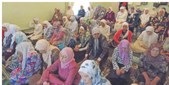
Праздничные мероприятия прошли в медресе «Нуруль-Ислам», в г. Октябрьский, в селах Туркменово, Московка, Муллино, Зайтово, Нарыш.